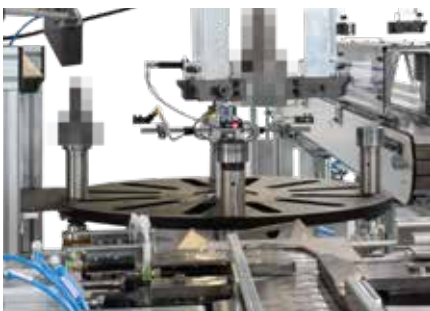
Blick auf den Rundtakttisch

Die Prüfergebnisse werden an einen dritten Roboter übermittelt. Dieser übernimmt die geprüften Teile vom Rundtakttisch und legt sie – je nach Ergebnis [iO-Teile, NiO-Teile, Nacharbeit] – auf die entsprechende Spur eines dreiteiligen Austragsbandes ab. Über die Spur werden die Gelenkzapfen in Kundenbehältnisse abgeleitet.