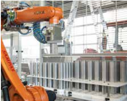
Der Drehtisch wird manuell über den Anlagenbediener mit den Rohteilen bestückt.