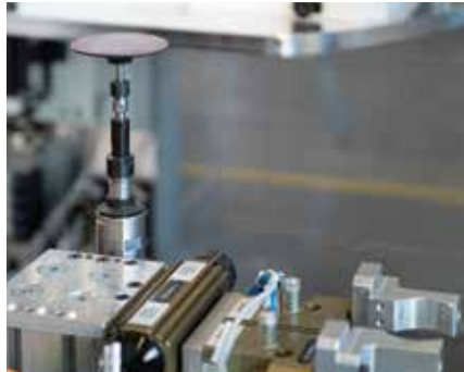
Der Roboter entnimmt ein Rohteil und legt es nach typspezifischen Abläufen (z.B. Entgraten, Wenden) in die Säge ein.